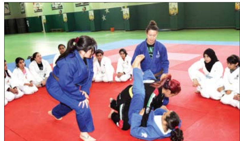
نقذه اتحاد الإمارات للجوجيتسو