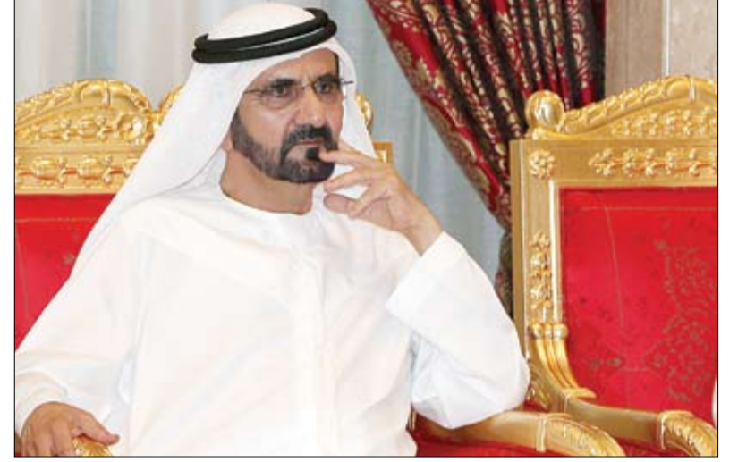
أمر بمنح الاتحاد مبلغ خمسة ملايين درهم