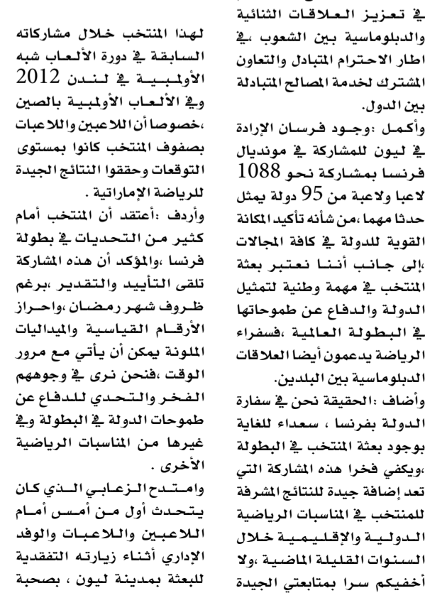
•• سامي عبدالعظيم - ليون