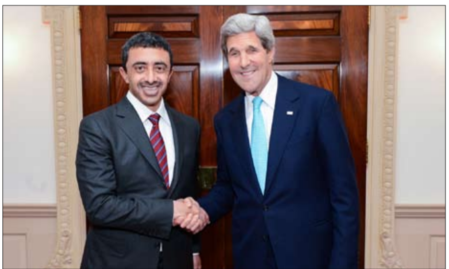
كبار محلي السياسة الخارجية بطاقم السفارة من الدبلوماسيين الأمريكيين. كما أدار سموه نقاشاً شارك فيه

•• المنطقة الغربية-وام: شهد سمو الشيخ حمدان بن زايد آل نهيان ممثل الحاكم في المنطقة الغربية مساء أمس الأول الأمسية الرمضانية الثالثة لحكومة أبوظبي في مدينة أبوظبي بالمنطقة الغربية بحضور أصحاب المعالي أعضاء المجلس التنفيذي لإمارة أبوظبي وكلاء ومديري الجهات الحكومية و500 موظف من الجهات الحكومية في المنطقة الغربية.