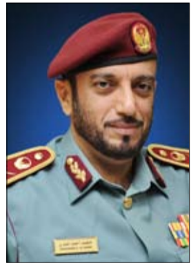
سعادة اللواء محمد المري