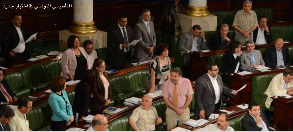
التأسيسي التونسي في اختبار جديد

وأكدت نفس المجلة أن النتائج بينت أن حركة النهضة تحصلت على 12 بالمائة من نوايا التصويت.. يشار إلى أن العينة المستجوبة شملت تونسيين من جميع جهات البلاد ومن مختلف الفئات العمرية والاجتماعية. وأضافت أسبوعية جون أفريك إن النتائج كانت صادمة بالنسبة لقيادات النهضة باعتبار أن الحركة تحصلت على نسبة نوايا تصويت اقل من التي منحتها إيها مؤسسات الاستطلاع التونسية.