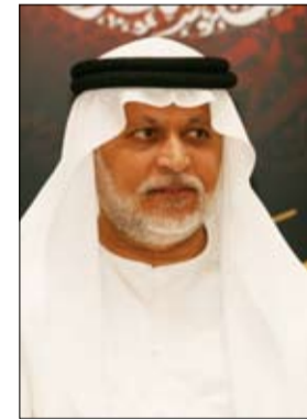
سعادة إبراهيم بوملحة

أشاد عدد من المسؤولين في إمارة دبي بمبادرة الأجر الرمضانية، إحدى مبادرات سمو الشيخ ماجد بن محمد بن راشد آل مكتوم، رئيس هيئة دبي للثقافة والفنون والتي تم إطلاق دورتها الثالثة بداية شهر رمضان المبارك تحت شعار (جزء الإحسان)، (أحسن لغيرك تضمن أجرك) والتي تتضمن عدة فعاليات وأنشطة خلال الشهر الفضيل منها محاضرات دينية توعوية ودروس يومية وخطب الجمعة وخطب رمضان وكتيبات توعوية حول أهمية الإحسان في التألف والتقارب المجتمعي. وحول هذا الموضوع، صرح سعادة المستشار إبراهيم محمد بوملحة مستشار صاحب السمو حاكم دبي للشؤون الثقافية والإنسانية قائلاً: يشكر سمو الشيخ ماجد بن محمد بن راشد آل مكتوم،