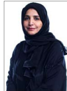
سعادة عذراء البسبي

رئيس هيئة دبي للثقافة والفنون على مبادراته القيمة في شهر رمضان وخطب الجمعة والتي تهدف إلى إحياء سنة وقيم المجتمع الإماراتي المسلم في الحث على الخير والتواصل والعمل الهادف بين أفراد. تتميز المبادرة التي تأتي هذا العام تحت شعار جزء الإحسان بحثها على عمل الخير والإحسان لأفراد المجتمع بغية نيل الأجر والثواب وذلك ما يتناسب وطبيعة هذا