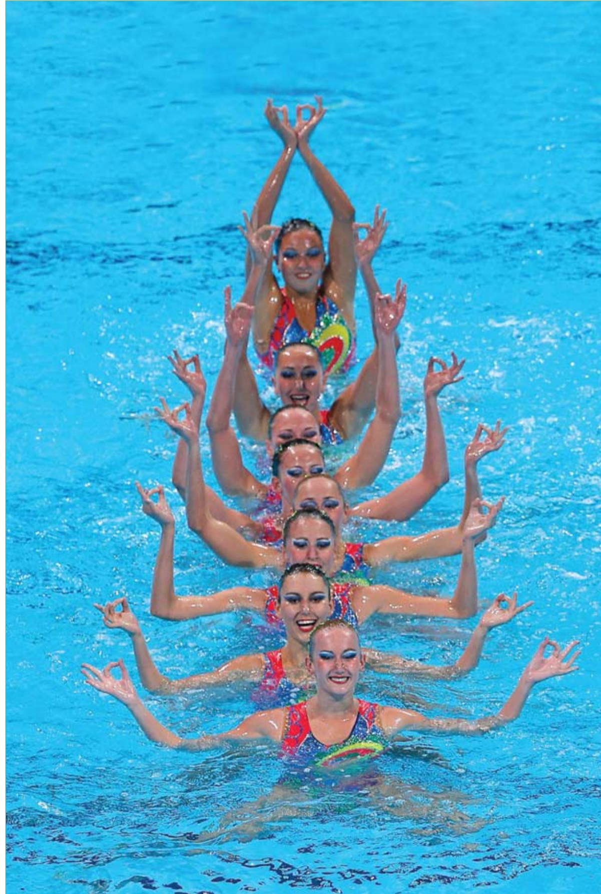
فريق الفتيات الأوكرانيات ينفذ عرضاً في تصفيات بطولة العالم للسباحة بسانت جوردي في برشلونة.